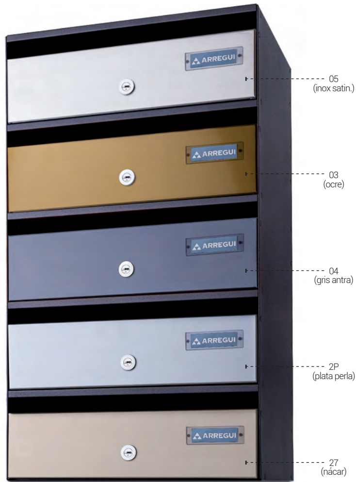
H3800 - Capacidad para documentos A4.