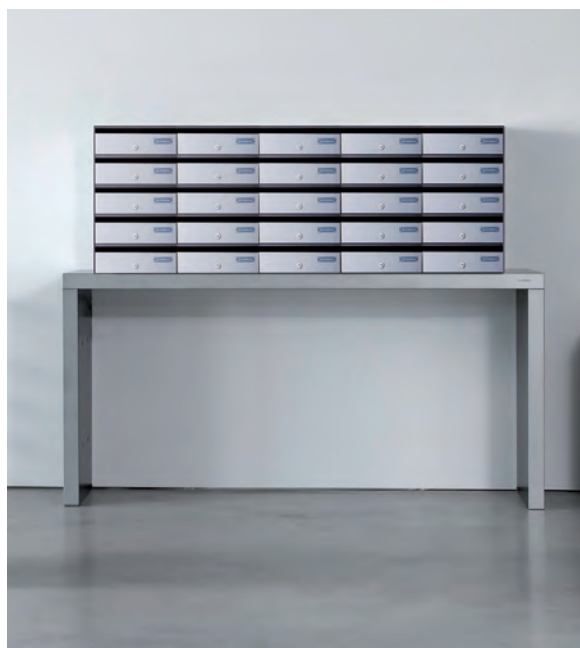
Buzones H3852P sobre una mesa.