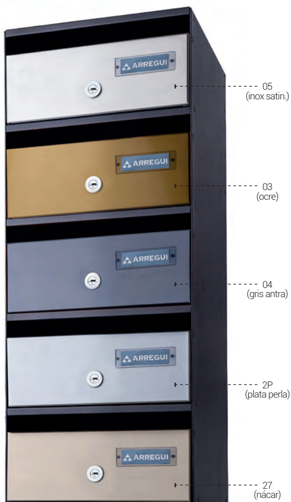
H3700 - Capacidad para documentos A5.