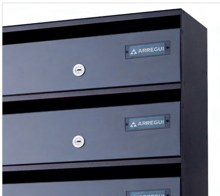
Las paredes laterales apenas son visibles, lo que aligera el conjunto.