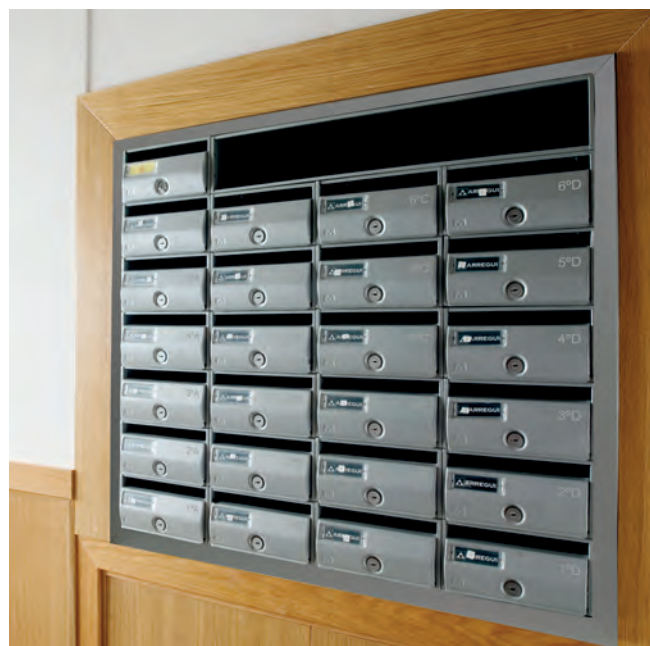
Buzones H3404P empotrados en pared con tapajuntas de aluminio.