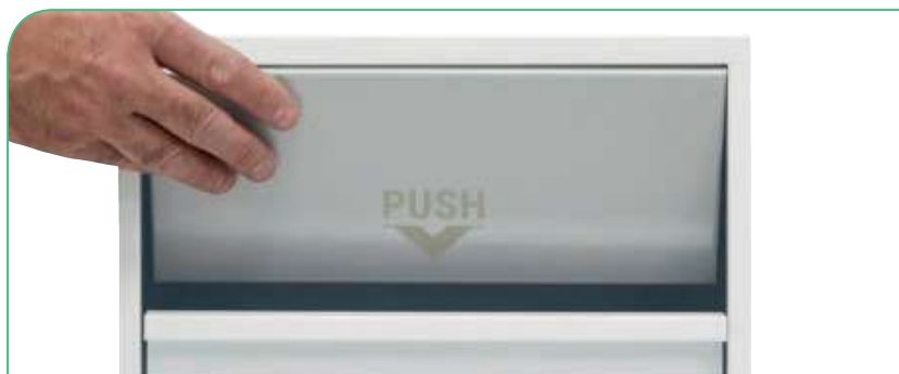
Apertura superior basculante.