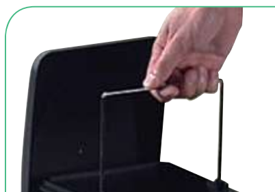
Cubos con asas que facilitan su extracción y limpieza.