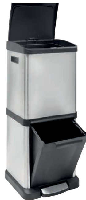
Cubeta superior Apertura mediante botón.