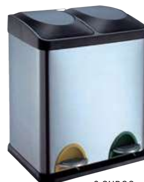
2 CUBOS CR705-30L