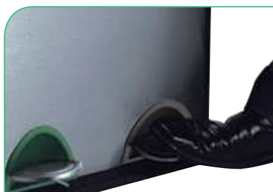
Apertura mediante pedal.