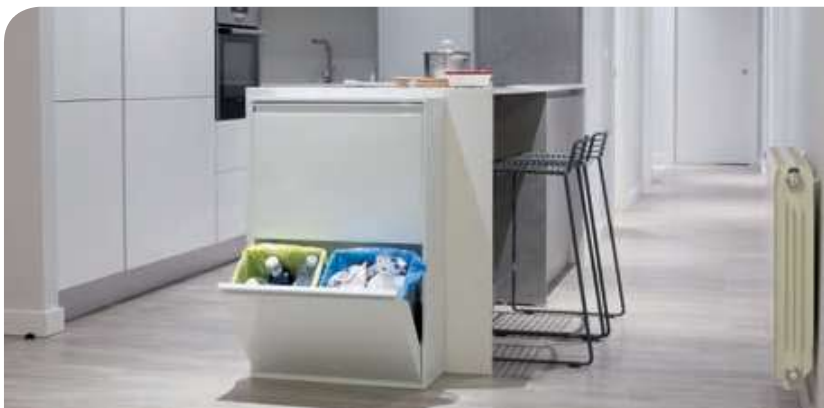
Se integra fácilmente en la decoración de cualquier cocina.