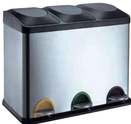
3 CUBOS CR705-45L