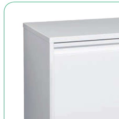
El cuerpo enmarca el frontal del contenedor.